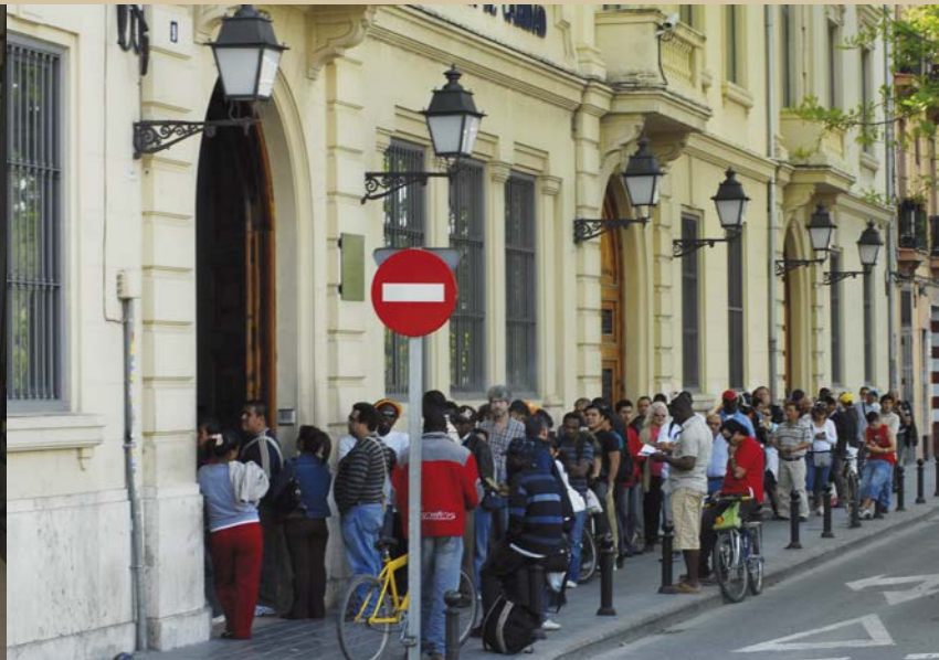
Instalaciones de Casa Caridad

Los requisitos mínimos de entrada exigidos tanto en el albergue como en el comedor son: ser mayor de edad o familias, tener autonomía física, disponer de documentación, no estar bajo los efectos del consumo de drogas o alcohol, seguir una pauta médica en caso de padecer enfermedades mentales y/o físicas, y aceptar la normativa interna que se entrega por escrito en la primera acogida.